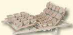
Motorrahmen mit Netzfreeschaltung