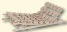
Sitz- und Fußhochstellung